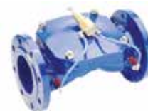
Selection of Anti-surge Valve